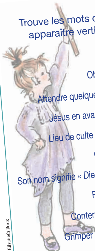
Dessins d'Elisabeth Roux

Trouve les mots correspondant aux définitions et tu verras apparaître verticalement le nom d'une fête chrétienne.